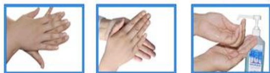
۱- یک دست را از ماده ضد عفونی کننده کاملاً بکشد.