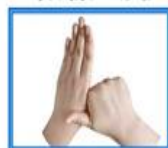
۴- یک دست را با انگشتان دیگر بکشد.