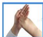
۹- یک دست را با انگشتان دیگر بکشد.