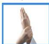
۸- یک دست را با انگشتان دیگر بکشد.