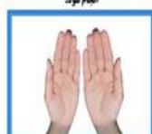
۷- یک دست را با انگشتان دیگر بکشد.