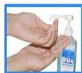
۳- یک دست را با انگشتان دیگر بکشد.