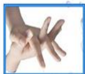
۶- یک دست را با انگشتان دیگر بکشد.