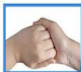
۵- یک دست را با انگشتان دیگر بکشد.